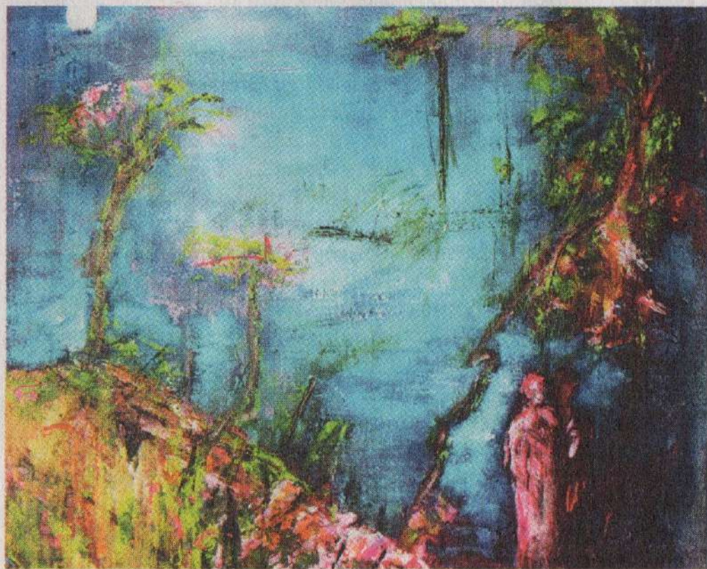
«Πάντα γυρίζω» (ακρυλικά σε καμβά). Έργο της Γεύσως Παπαδάκη από τη νέα έκθεση στην γκαλερί Cube.

Τα περισσότερα έργα είναι από την ενότητα «Της αγάπης συλλα-